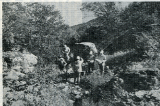
上は町有林を視察する一行