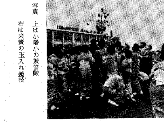
写真は、上は小幡小の鼓笛隊、右は来賓の玉入れ競技