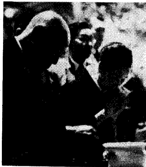
悲しみのお別れをするふじ未亡人