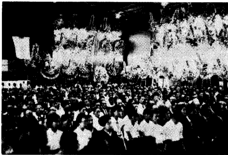
式場をうめつくす会葬者とかがざられた花輪(向う側)

町では、八月十四日に死去された齊藤町長を、同日たまたまこの風雨が葬儀の進行に連れて強烈となり、十四号合風の影響とはいいながら、それが齊藤町長の死に激涙した天風大雨の感をおび、風雨の建物をつちつける音は、あたかも、昇天なさる「みたま」への葬送曲かのようでした。 当日は、関係者の心配をよそに風雨模様となり、来客も迎える者も、混雑してひと苦勞でした。 この風雨が葬儀の進行に連れて強烈となり、十四号合風の影響とはいいながら、それが齊藤町長の死に激涙した天風大雨の感をおび、風雨の建物をつちつける音は、あたかも、昇天なさる「みたま」への葬送曲かのようでした。