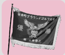
グラウンドゴルフ大会優勝旗