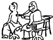
健康家庭と優良赤ちゃんとを表彰し

これは、国民皆保険がさげばれているなかで、国民健康保険事業が順調に運営されるよう協力してくれた家庭の表彰で、今後、さらに国民皆保険の運営向上を図るために行ないます。 ことし表彰される家庭は、昨年4月1日からことしの3月31日までの間病気などをせず、国民皆保険の利用がなかつたことのうち保険料を完納している者などです。 また、優良乳幼児は、昨年7月からことしの6月末日までに生れた乳児で、国保が実施した秋季検診で優秀な成績であったものです。