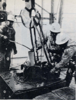
▲クレーンで釣り上げ、ボーリングの鋼管 顧ぎは慎重に行われる