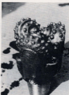
▲ドリルの最先端がこれだ！「トリコンビット」 三個のローラーが回転しながら剛着して行く

に付して温泉地としての周知徹底を図る。桑畑町小幡、白倉温泉の一大キヤラバン隊を各都市に送り、観光地・温泉地としての宣伝を行い、顧客の誘致を図り、町の発展・地域の発展と活性化を図る。三月一日 夢物語り