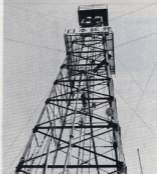
▲白倉下屋敷数地内にそびえ立つ鉄塔、夜になると 電灯がつき、遠くからでもわかります