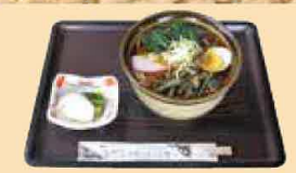
山菜そば・うどん (各)550円 ※写真は山菜そばです。