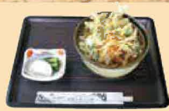
天ぶらそば・うどん (各)660円 ※写真は天ぶらうどんです。