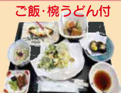
ふるさと館定食 1,650円