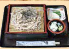
ざるそば・うどん (各)550円 ※写真はざるそばです。