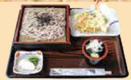
天ざるそば・うどん (各)880円 ※写真は天ざるそばです。