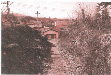
町道立足中町西側線

②小幡地区の町道立足中町西側線についても現状は土手が崩れ道幅が4分の1くらいになり、3基の供養塔が今にも崩れそうになっています。この件についての進捗状況を伺います。