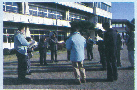
旧二中跡地活用状況 (学童保育)