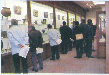
古代館の運営状況視察