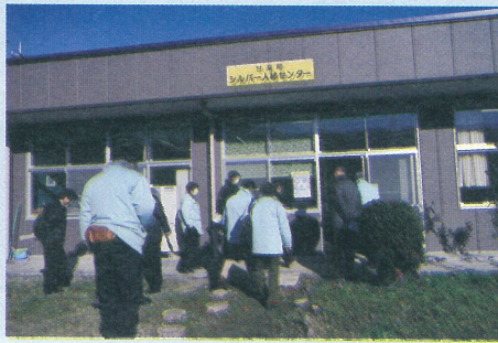
旧二中跡地活用状況 (シルバー人材センター)