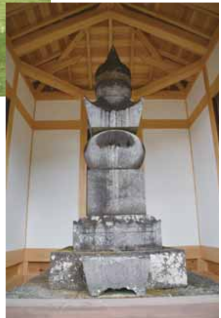
のぶかつ 織田信雄公の墓石