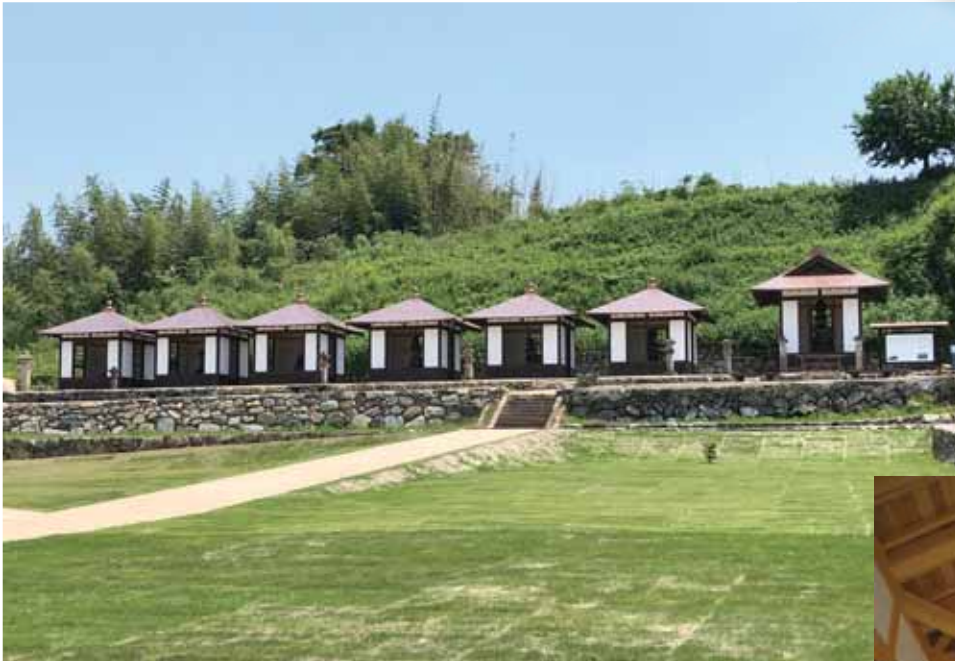
織田公公園・七代の墓