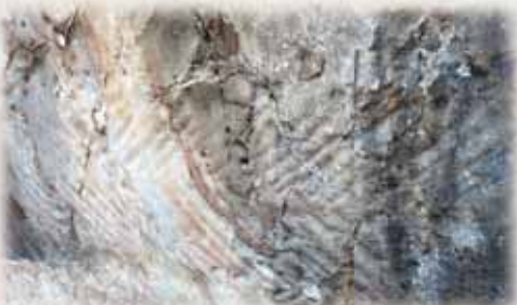
ノミ状工具で削った跡