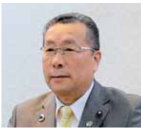
やま だ くに ひ こ 山田 邦彦 議員