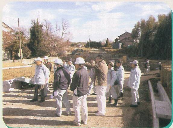
▲金井遠出居地区工事現場