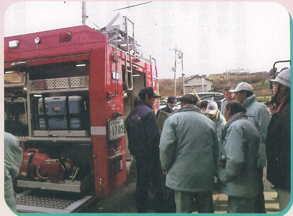
▲甘楽分署にて新車両の視察