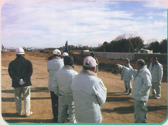
▲統合中学校建設予定地