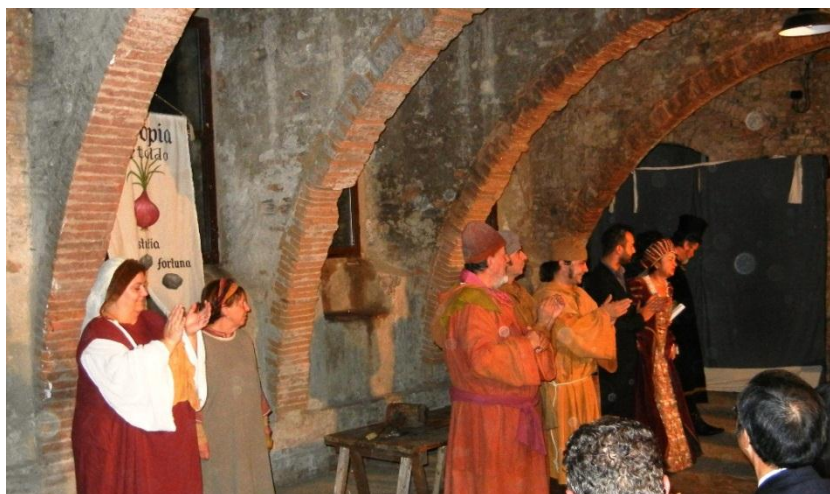
エルトルピア協会「ボッカチオのある説話」寸劇上演(チェルタルド・アルト地下倉庫)