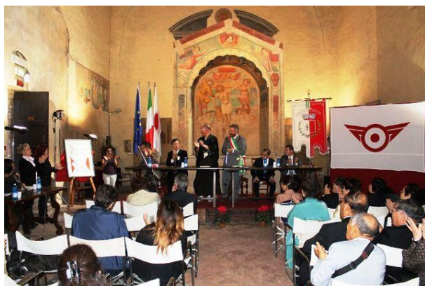
30周年記念式典(チェルタルド市プレトリオ宮殿)

イタリア共和国チェルタルド市との友好親善姉妹都市協定締結30周年をむかえ、2013年10月、茂原町長を団長として、当協会からは理事長ほか2名が訪伊し、チェルタルド市で開催された記念式典・記念行事に出席しました。10月22日に催された式典では、在イタリア日本国大使館公使、歴代チェルタルド市長及び関係者が参列する中、茂原町長とカンピノーティ市長により、これから友好交流の努める旨の再確認書の調印が行われました。