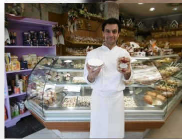
▲パンフォルテ・カントウッチーニ・雑貨などを販売します