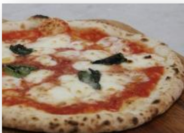
▲食のフェスタ特別ピザと本場特製ソースのペンネを無料試食できます

このイベントは、日本イタリア国交150周年であり、甘楽町と友好親善姉妹都市であるイタリア・チェルタルド市との相互派遣の年である今夏、町内中学生とイタリア・チェルタルド市からの使節団との協同事業により、姉妹都市交流の深化、道の駅甘楽のPRと来町者増加、両都市の地域農産物・食材を活用した食の開発を総合的に推進するため開催する食のイベントです。当協会もこのイベントを後援し、多くの皆様がイタリアの食文化に触れ、国際交流への理解をより深めていただけるよう協力を行います。当日は、道の駅甘楽でパスタとピザを無料で試食していただけますので、ぜひご参加ください。