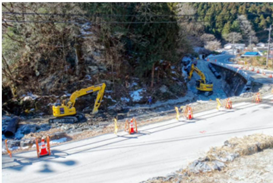
災害復旧工事が進む秋畑河振地区