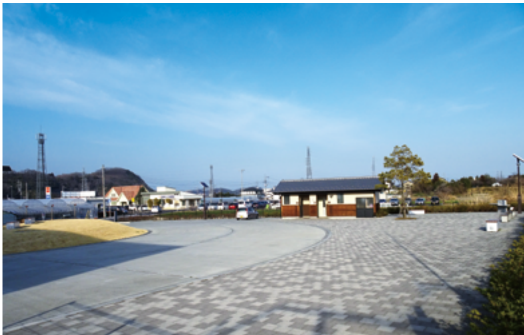
避難拠点機能を備えた福島北防災広場