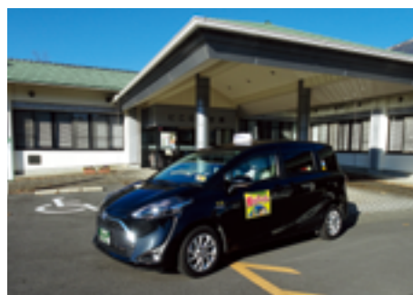
町民の日常を支える移動手段のデマンドタクシー