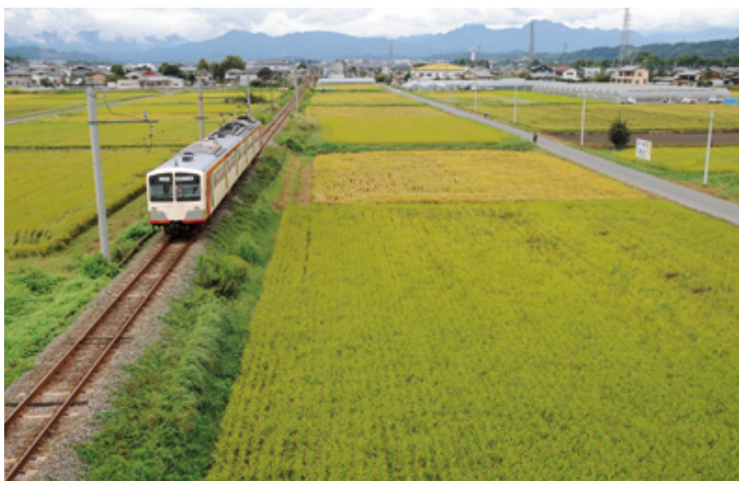
田園を走る上信電鉄