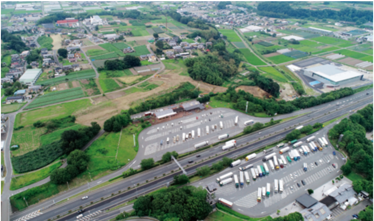
令和5年3月開通に向けて整備が進む甘楽スマートインターチェンジ