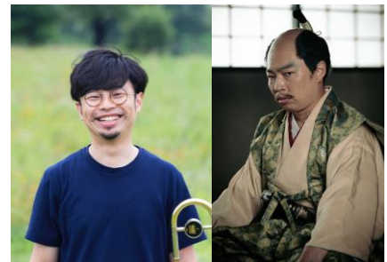
▲ 特別ゲスト 浜野 謙太 さん