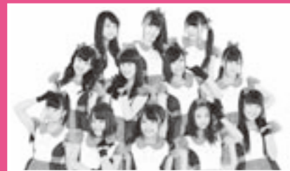
ライブショー あかぎ団

乗馬コーナー・各種出展コーナー・野点コーナー・試食コーナー 緑の募金コーナー・殺陣演舞・小動物コーナー