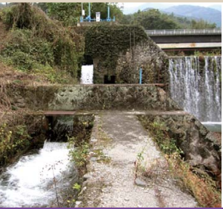
33 大口(雄川堰取水口) Water intake of Ogawa channel

慶応元年(1865年)、7ヶ月と250人の手間を費やして造られた吹上の石樋。雄川から引き入れた水は、長さ7.7mの巨大一枚岩を組み合わせたこの石樋を通り、雄川堰へと流れていきます。(町指定重要文化財)