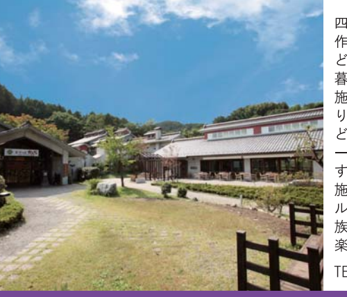
30 達磨窯 Daruma gama (a tile-kiln)

四季折々の行事や農作業、手作り工作などを通して、農村の暮らしを体験できる施設。こんにやく作りや農産物の収穫など様々な体験メニューが用意されています。定員83名の宿泊施設やレンタサイクル20台もあり、ご家族や友人同士での行楽に最適です。TEL: 0274-74-2660