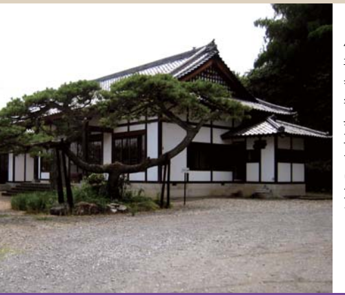
35 崇福寺 Sofukuji temple

小幡は元和元年(1615年)に織田氏の所領となり、以来152年にわたって治められました。初代信雄から七代信富までの墓が崇福寺の旧境内に建っています。(町指定史跡)