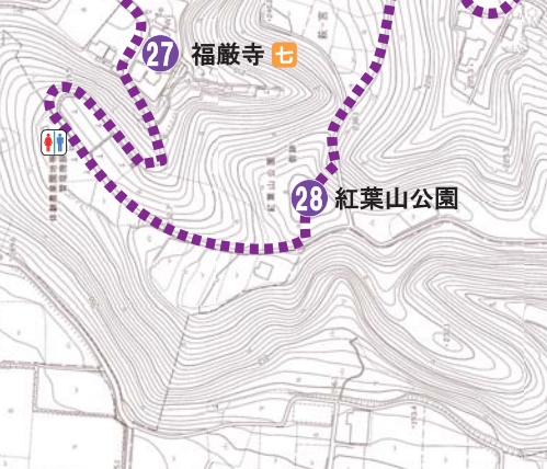
28 紅葉山公園 Momijiyama Park

七福神の1つである福祿寿さまを祀っています。裏にある紅葉山は、楽山園の借景のため紅葉が移植された小高い山で、紅葉の名所になっています。