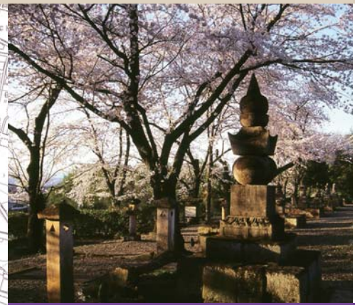
36 織田宗家七代の墓 The cemetery of Oda clan

小幡は元和元年(1615年)に織田氏の所領となり、以来152年にわたって治められました。初代信雄から七代信富までの墓が崇福寺の旧境内に建っています。(町指定史跡)