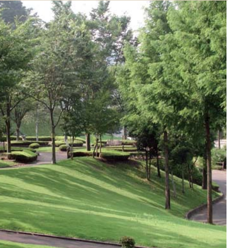
31 甘楽総合公園 Kanra comprehensive park

甘楽ふるさと館の敷地内に、伝統的な燻し瓦を焼く土の窯が復活しました。富岡製糸場建設時の瓦も同様な窯で焼成されています。達磨窯で焼いたものは焼き物としての味や風合いが感じられます。