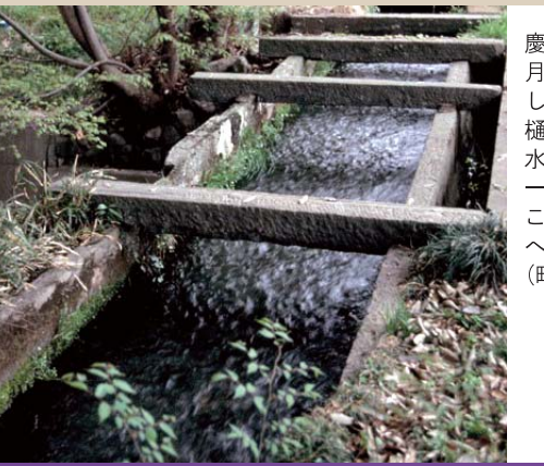
34 吹上の石樋 Historic stone gutter

4代小幡藩主・織田信久が織田家歴代の菩提寺とする為、廃寺だった崇福寺を3年の歳月をかけて再興しました。背後に並ぶ織田氏七代の墓や、正面の下馬の碑は、甘楽町指定重要文化財等に指定されています。