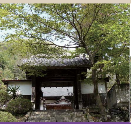
32 長厳寺 Chogonji temple / 天狗岩 Tengu-iwa

「日本の歴史公園100選」にも選定されている甘楽ふるさと館隣接の公園。広大な自然の中に充実したスポーツ施設があり、運動したり、遊歩道を散策したり、自然との触れ合いを楽しめます。