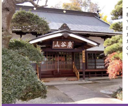
27 福厳寺 Fukugonji temple

小幡の桜並木中程にある小幡八幡宮の裏山の公園です。標高234.6mの高さから、街を360度見渡すことができ、抜群の展望を誇ります。「木もれびのみち」「花染めのみち」など、バリエーション豊かなトレイルコースが整備されており、散策を楽しむことができます。