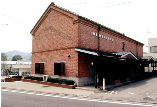
18. 歴史民俗資料館(旧甘楽小幡組製糸レンガ造り倉庫)