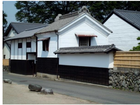
17. 小幡藩勘定奉行「高橋家」