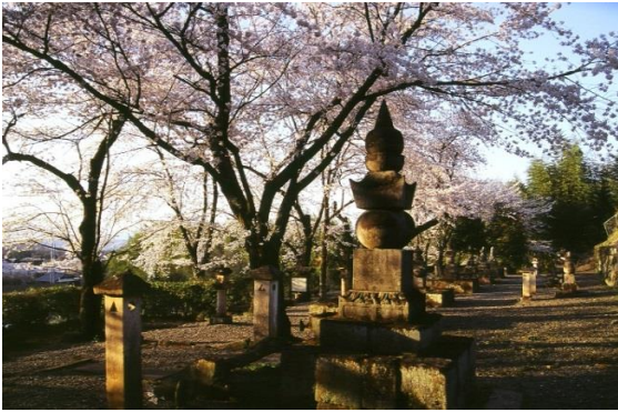
10. 織田宗家七代の墓