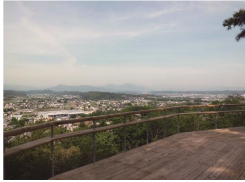
25. 八幡山夕陽ヶ丘公園