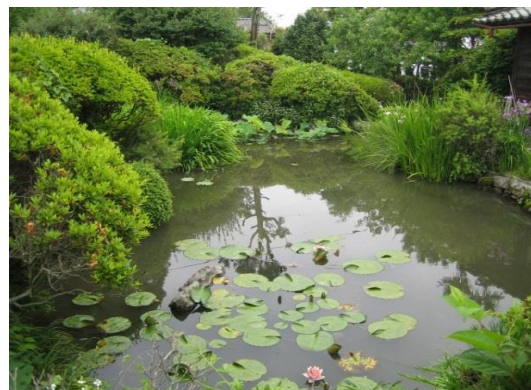
15. 松平家大奥の庭園