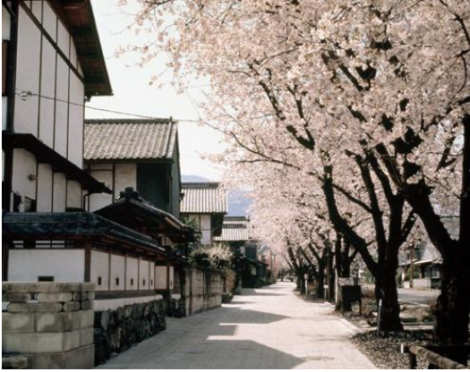
26. 養蚕農家の町並み