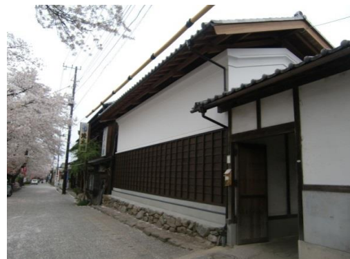
21. 歴史民俗資料館別館「有賀茶屋」