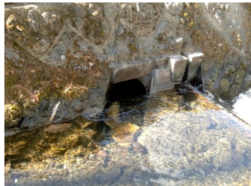
11. 雄川堰一番口取水口