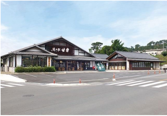
起終点 道の駅甘楽