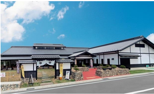
2. 長岡今朝吉記念ギャラリー