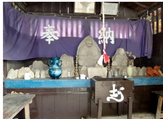
13. 城町薬師堂の石仏