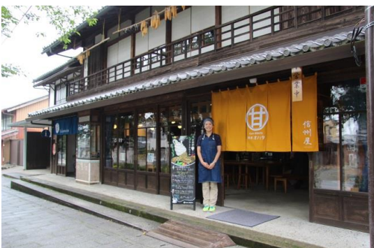
22. 古民家かふえ「信州屋」