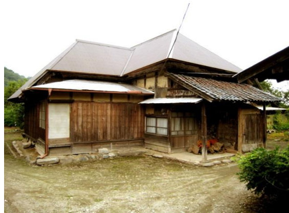
5. 旧小幡藩武家屋敷松浦氏屋敷