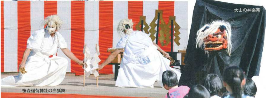
笹森稲荷神社の白狐舞