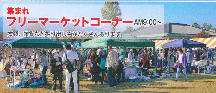
集まれ フリーマーケットコーナー AM9:00~ 衣類、雑貨など掘り出し物がたくさんあります。

メイン会場のお祭り広場では、地粉ピザや模擬店、つくたてのお餅や町の特産品でお腹を満たしながら、大人気の新鮮農産物の即売、ゲームやフリーマーケットなど盛りだくさんのイベントを満喫できます。また特設舞台では、町内各地区の民俗芸能が披露されます。さらに文化会館では、書画や盆栽などの文化部門の作品が多数展示されています。甘楽町の秋の一日をゆっくりとご堪能ください。皆様のご来場をお待ちしております。