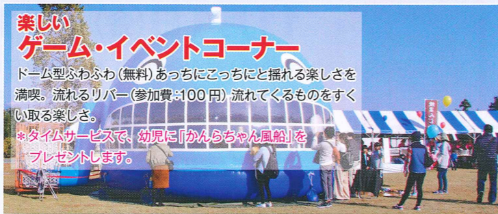
楽しい ゲーム・イベントコーナー ドーム型ふわふわ(無料)あつちこつちにと揺れる楽しさを満喫。流れるリバー(参加費:100円)流れてくるものをつくい取る楽しさ。 *タイムサービスで、幼児に「かんらちゃん風船」をプレゼントします。