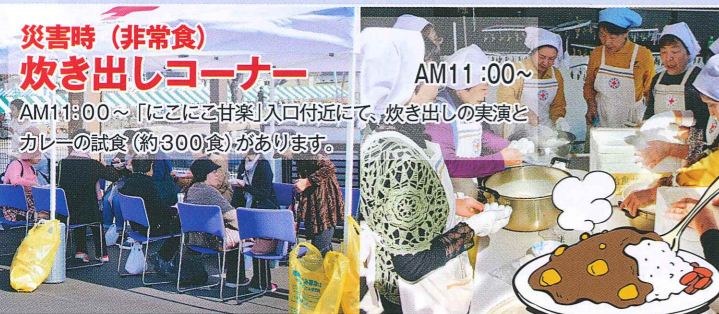
災害時(非常食) 炊き出しコーナー AM11:00~ AM11:00~「にこにこ甘楽」入口付近にて、炊き出しの実演とカレーの試食(約300食)があります。