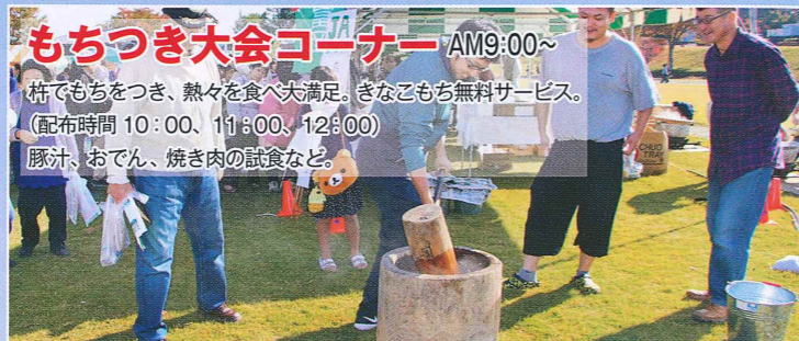
もちつき大会コーナー AM9:00~ 杵でもちをつき、熱々を食へ大満足。さなごもち無料サービス。 (配布時間 10:00、11:00、12:00) 豚汁、おでん、焼き肉の試食など。