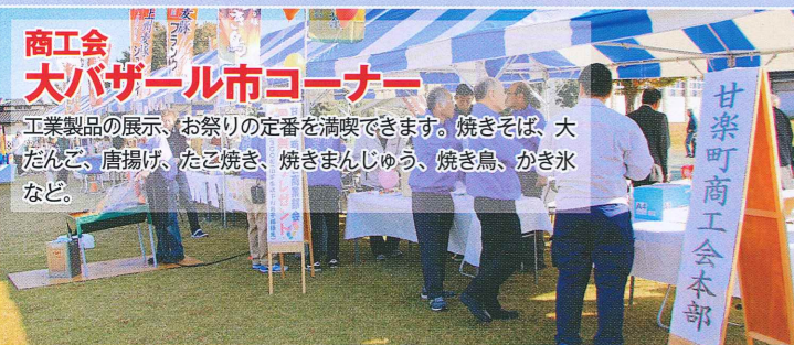
商工会 大バザール市コーナー 工業製品の展示、お祭りの定番を満喫できます。焼きそば、大だんご、唐揚げ、たこ焼き、焼きまんじゅう、焼き鳥、かき氷など。