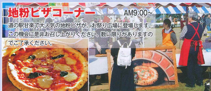
地粉ピザコーナー AM9:00~ 道の駅甘楽で大人気の地粉ピザが、お祭り広場に登場します。 この機会に是非お召し上がりください。数に限りがありますのでご了承ください。