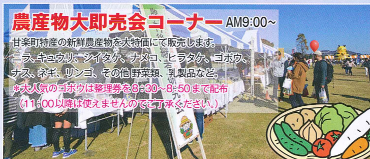
農産物大即売会コーナー AM9:00~ 甘楽町特産の新鮮農産物を大特価にて販売します。 ミラ、キュウリ、シイタケ、ナメコ、ヒラタケ、コボウ、ナス、ネギ、リンゴ、その他野菜類、乳製品など。 *大人気のコボウは整理券を8:30~8:50まで配布(11:00以降は使えませんのでご了承ください。)