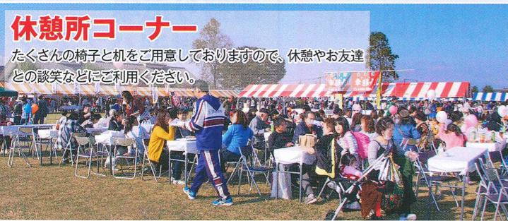
休憩所コーナー たくさんの椅子と机をご用意しておりますので、休憩やお友達との談笑などにご利用ください。