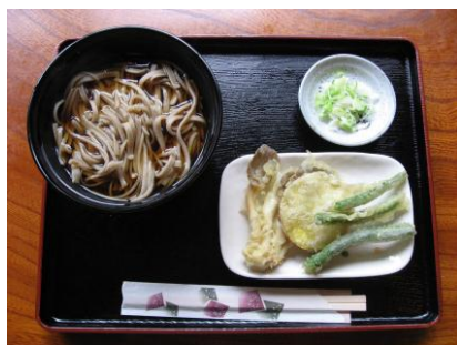
温かいそば (期間限定)