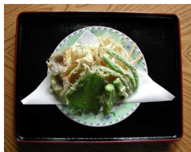
天ぷら (材料は季節により替わります)