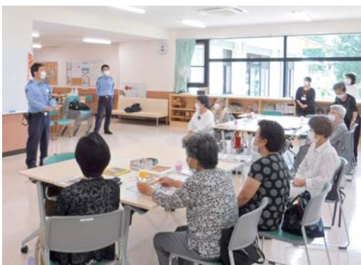
高齢者向けの交通安全教室を開催 (11/11)甘楽

新型コロナウイルス感染症の影響で規模を縮小し、富岡警察署による交通安全教室や交通指導員・富岡交通安全協会などによる巡回広報、街頭監視で交通安全を呼び掛けました。