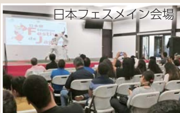
日本フェスメイン会場