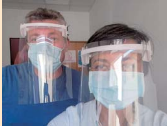
広報かんら8月号で紹介したフェイスシールドは、同月下旬にイタリア・チェルタルド市に到着し、活用されています