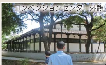
コンベンションセンター外観

白壁と瓦屋根が特徴的なコンベンションセンター。日本フェスティバルでは、大広間をメイン会場に、日本文化を紹介・体感するイベントが開催されました。ラジオ体操、空手など日本武術の実演、日本語スピーチコンテストなどが行われ、調査団も柔道演武と甘楽町のプレゼンテーションを実施しました。