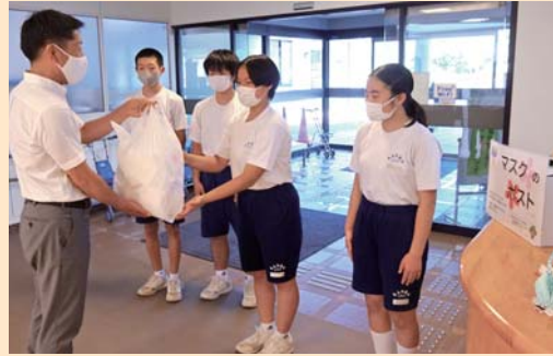
マスクをここに甘楽へ届けた、甘楽中の奉仕委員会代表の皆さん