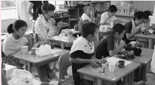
小幡小の歯磨き指導

健康な歯は財産です。これからもきちんと管理を続け、歯を大事にしてください。(敬称略)