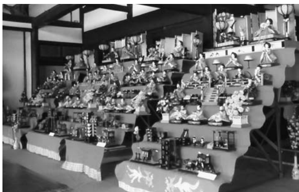
昨年の雛祭り展示(松井家住宅)