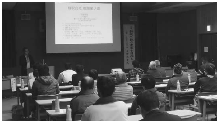
持続可能な農業を目指す取り組みが紹介された講演会

講演では、持続可能な農業を目指すために自社で取り組んでいる事例を具体的に映像を交えて紹介されたほか、未来の農業に向けた