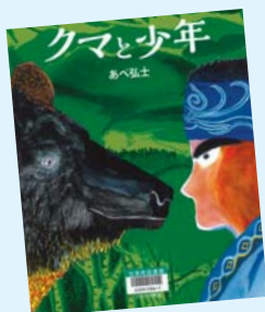
クマと少年 あべ弘士 作/ブロンズ新社 山の神クマとアイヌの少年をめぐるとの物語