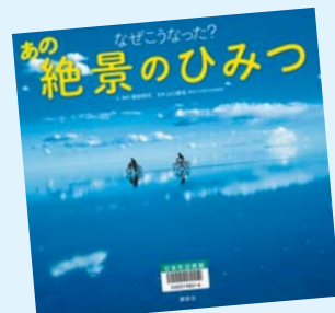
なぜこうなった？ あの絶景のひみつ 増田明代 文・構成/講談社