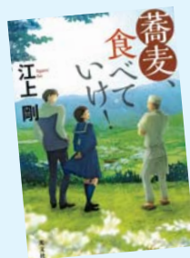
蕎麦、食べていけ！ 江上 剛 著/光文社