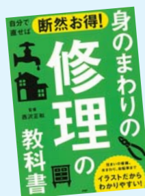
自分で直せば断然お得！ 身のまわりの修理の教科書 西沢正和 監修/PHP研究所