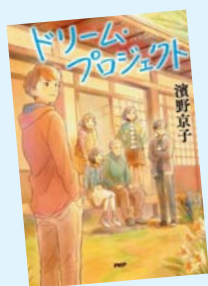
ドリーム・プロジェクト 濱野京子 著/PHP研究所 少年の「古民家再生」物語

1人1冊1週間の貸出です。(対象の児童・生徒を優先)小学生～高校生まで全部で18冊用意しました。慌てないよう、早めに準備しましょう！