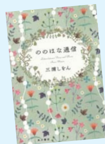
ののはな通信 三浦しをん 著/KADOKAWA