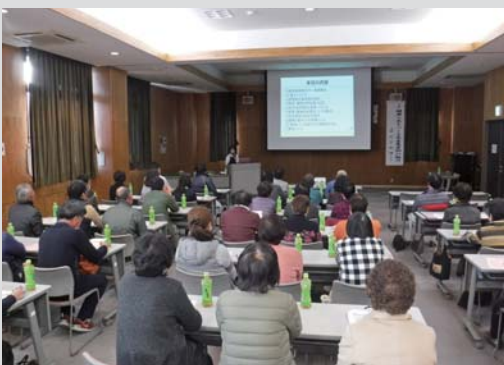
女性を中心に多くの参加者が野菜の効能などを学んだ講演会