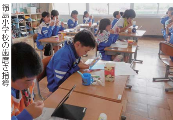
福島小学校の歯磨き指導

健康な歯は財産です。これからもきちんと管理を続け、歯を大事にしてください。(敬称略)