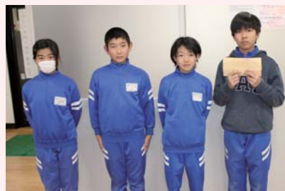
福島小学校児童会の皆さん