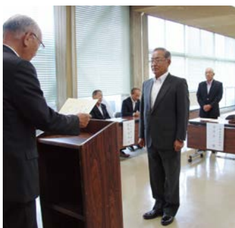
委嘱状交付式の様子