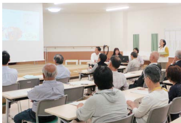
活動中の居場所の紹介を聞く参加者