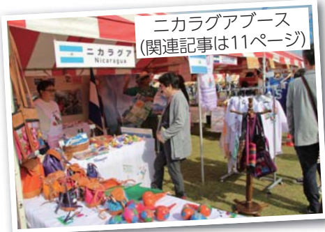
ニカラグアブース (関連記事は11ページ)