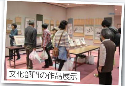
文化部門の作品展示