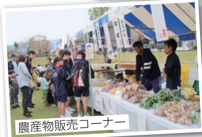
農産物販売コーナー