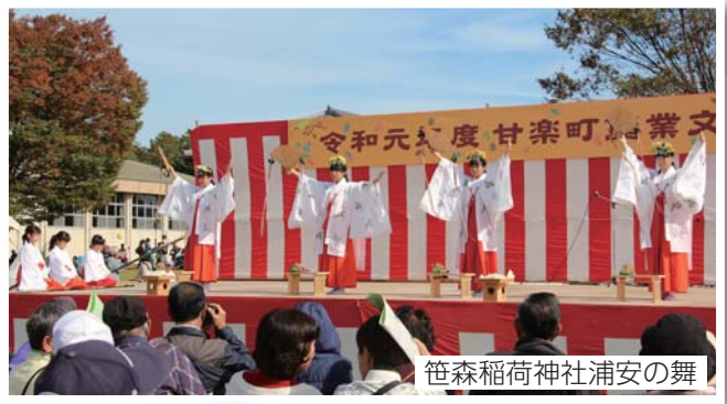
笹森稻荷神社浦安の舞

町を挙げての産業と文化の祭典、産業文化祭がふれあいの丘で開催されました。秋晴れの空の下、大勢の皆さんにお集まりいただき、にぎやかな一日となりました。