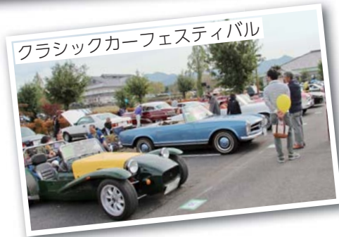
クラシックカーフェスティバル