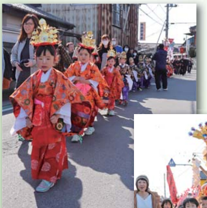
↑4月に小学校入学予定の子どもたちによる稚児行列 →元気にみこしを担ぐ子どもたち

恒例の春季例大祭が行われ、山車やみこし、稚児行列などが練り歩きました。翌10日には、みこしを奉納し、露天市に大勢の人が訪れました。