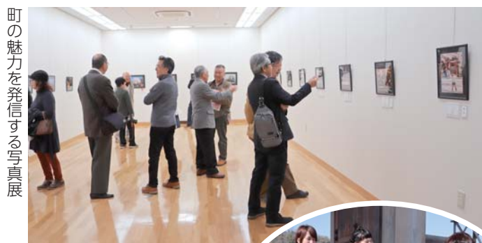
町の魅力を発信する写真展