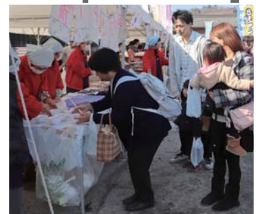
行列の無料配布コーナー