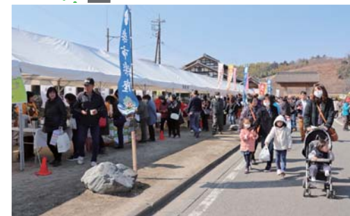
見て、食べて、体験。にぎやかな御殿前通り