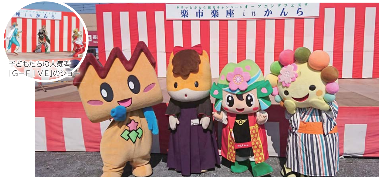
子どもたちの人気者「G-FIVE」のショー