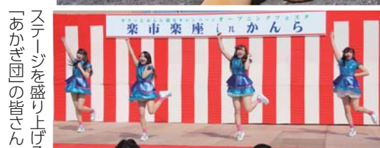
ステージを盛り上げる「あかぎ団」の皆さん