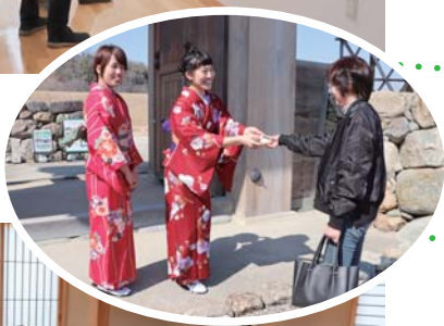
地域おこし協力隊員は和装でお出迎え