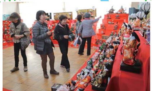
感動の音が響く雛祭り展示会場